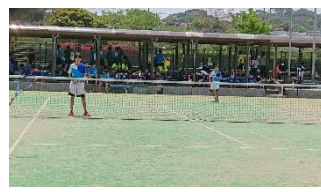
男子 予選リーグ2位 女子 4位