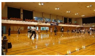
卓球部 男子 準優勝 女子 優勝