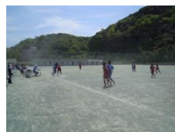
バスケットボール部