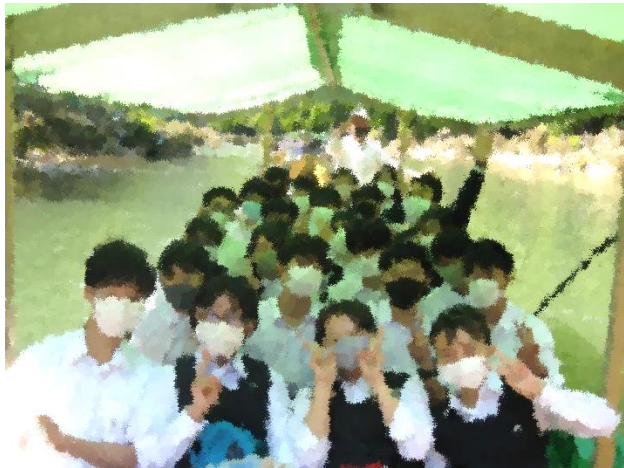
保津川 川下り

いろいろな人の出会いが皆さんの学びを豊かにしてくださっています。皆さんにも、自分たちが暮らす街を誇りに思い、魅力を伝えられる人になってほしいと思います。