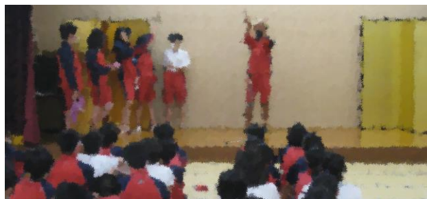
盛り上がった学年レク 拍手！！