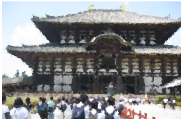
東大寺 大仏殿 スケールの大きさにびっくり

5月22日から24日にかけて、3年生修学旅行として京都・奈良へと出かけてまいりました。コロナ禍での入学でしたので、これまで大きな学校行事を経験していません。ある意味初めての校外学習が修学旅行になるなんて、ちょっとハードル高いなあと思いましたが、3年生の皆さんは現地の皆さんにも元気