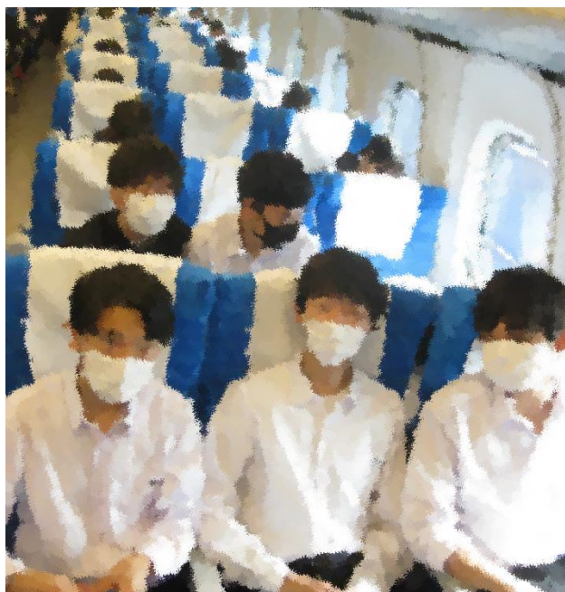
初めて新幹線に乗った人もいるはず……