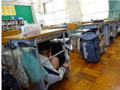
まずは一次避難。全員机の下へ

ただし、何事も「想定外」と言うことはあるものです。場合によっては、観音崎公園に避難する事もあり得る事は、生徒の皆さんにも伝えました。