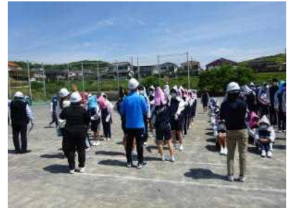
2次避難は標高15mのグラウンドへ