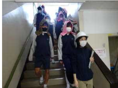
地震が収まり、2次避難開始