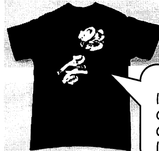
【 後側 】