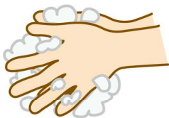
洗う場面は多くあります！

・学校生活の中で、手を洗うことが感染から自分自身を守ることができます。手を洗った後が気になる場面があります。ハンカチやハンドタオルが使えるようにご準備くださいますようお願いいたします。チャック付きのビニール袋に2枚～3枚ハンドタオルを入れ、ランドセルに入れ、予備としておくと汚れたときや忘れてしまったときに使えます。