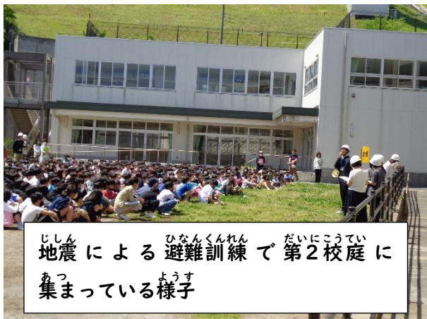
地震による避難訓練で第2校庭に集まっている様子

火災による避難訓練、地震による避難訓練、引き取り下校訓練・・・全校児童が集まる防災訓練を3回行うことができました。コロナ禍で3年間一度も全校で行うことができなかったのに、年度初めに予定どおり実施することができ、非常に学びになりました。よかった点も反省点も次回にいかせるよう、ふりかえっていきます。今後も感染症の動向を注視しながら、前向きな姿勢で教育活動に取り組んでいきます。