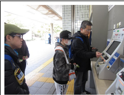
シーサイドラインの切符を買っています