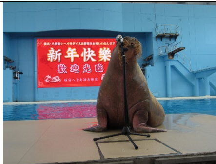
セイウチによるあいさつ