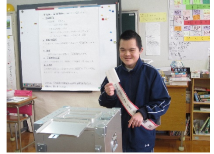
さあ、笑顔で投票箱に

昨年の4月に新入生を迎えたと思ったら、早いもので6日(火)に卒業式予行があって、14日(水)は卒業式です。小学部と高等部の二人を送り出します。在校生の3人で『在校生からのお祝いのことば』を話します。今その練習をしています。1回目の練習で、自分が話すところはだいたいできました。14日の本番も立派にできると思います。