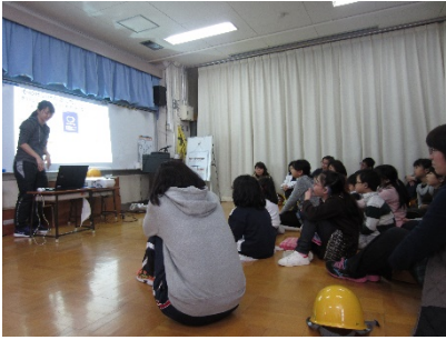
K先生の話みんなシーンと