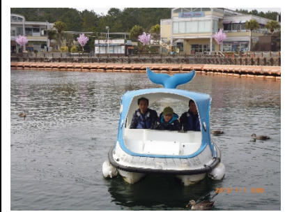
3人でボートに乗っています