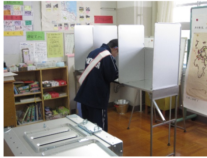
信任の〇を書いているのかな？