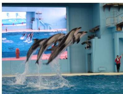
イルカの大ジャンプをみました