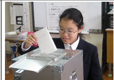
来年度の生徒会のことを想って1票を投じました。