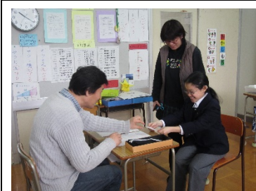
投票所入場券を選管に提出し、投票用紙を受け取っています。