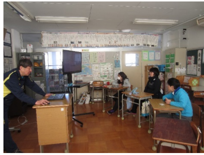
最初から最後まで画面を見ていました