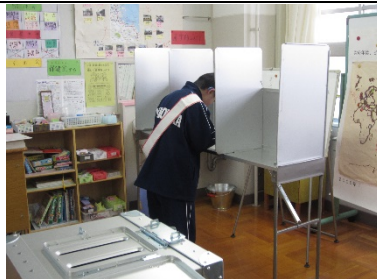
ろう学校生徒会のために頑張ってくれることでしょう。