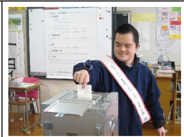
「あいさつのできる学校に」と思いを込めて投票。