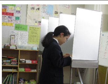
記入する姿は真剣そのもの。