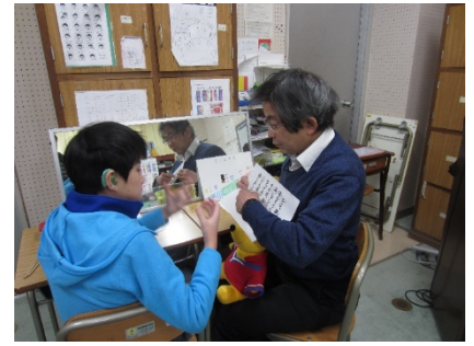
在校生からのお祝いのことばの練習

14日(水)の朝の会の様子です。司会の先生がニュースで、いじめの問題を取り上げて話してくれました。(3回シリーズです。)左の写真にあるように、長い文章で、内容的にも難しいかな?興味を示さないのではないかと心配しました。ところが、読みに合わせて、先生が動かすテレビ画面上のカーソルを見て、手話をしながらはじめて終わりまで読んでいました。これほど長い文章を読んでいこうとしているのを見たのは初めてです。最近教科書など、いろいろな本を積極的に読もうとしてきた成果が表れたのでしょうか。