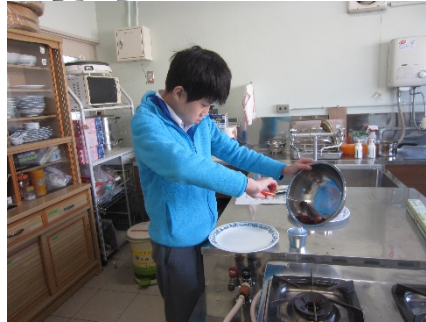
お玉を使って容器に入れました