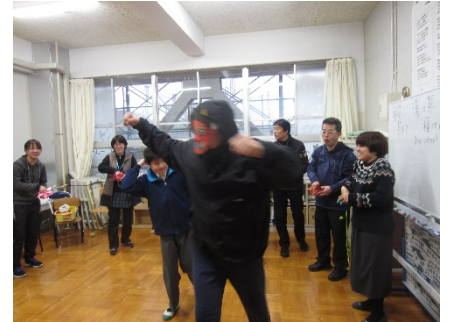
鬼はそと、鬼はそと

卒業式の時ステージの上に掲げられるパネルのスローガンを考えるのは、中高等部の担当です。30日(火)、スローガンにふさわしい言葉をお互いに出し合いました。この日に決定しないで、再度話し合うことにしました。5日(月)に決まりました。『行こう!君のかがやく未来へ』