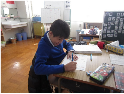
国語の自習、プリントに取り組んでいます