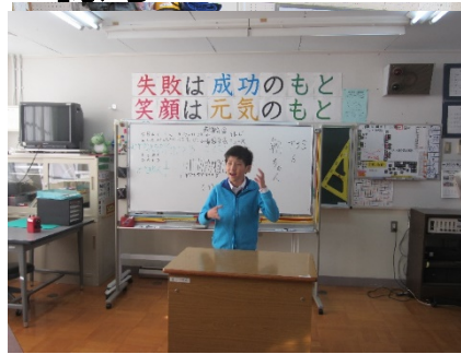
朝の会の司会、ニュースを発表