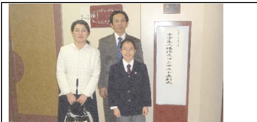
去年に引き続き中2の晴れ舞台にかけつけてくださったご両親

昨年は奨励賞でしたが、今年は銅賞をいただきました。市役所1階に中2が書いた作文のパネルが飾られてあります。