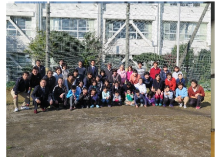
全校集合写真、1回目

27日(月)に毎年行っている歯科巡回教室がありました。今回は残念ながら参加することができませんでしたね。歯科衛生士さんが、歯周病のことを詳しく話してくれました。歯周病のおそろしさ、歯を磨くことがいかに大切であるかを、参加した生徒は分かりました。