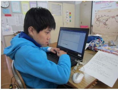
前にある文章を見て打ち込みしました