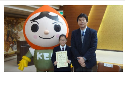
指導してくださった先生と記念写真