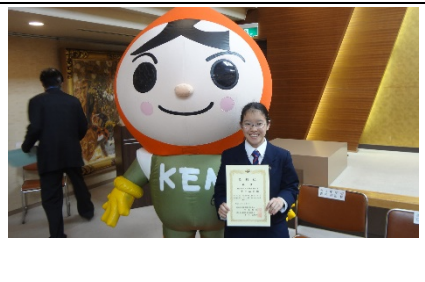
中2の好きなゆるキャラと