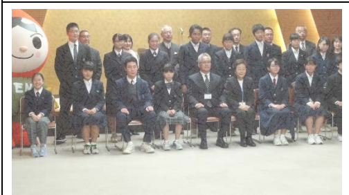
受賞者たちと記念写真