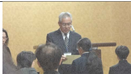
賞状をもらっているところです