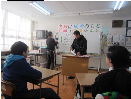
今日のニュースは祝日について