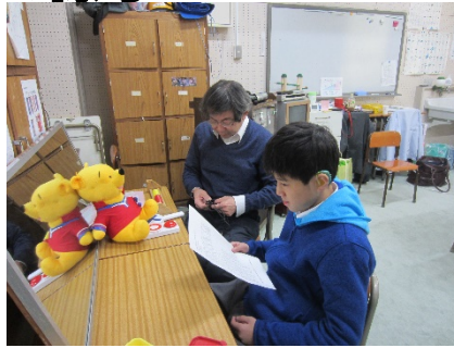
発音調査の結果を見ました