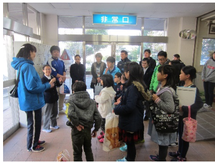
玄関前で担当の先生の話聞いています。