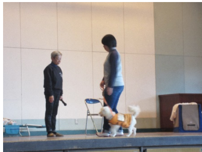
聴導犬の仕事ぶりを見ています。