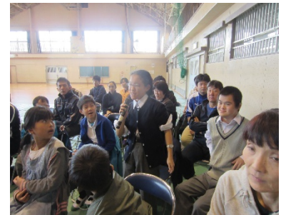
大矢部中からの質問に答えています。