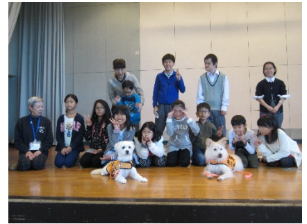
聴導犬と一緒に記念写真

11日(土)にかしわ祭が終わり、いつもの日課にもどりました。14日(火)の朝の会は司会でした。司会があることを連絡していなかったため、ニュースの発表が大丈夫かなと心配しました。その日にある数学の授業で、どんなことを学習するのか発表しました。