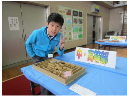
夏休みの作品展に出した「迷路」