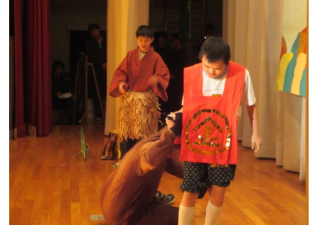
かしわ祭本番、3幕、金太郎の登場

8日(水)朝の会の時に、手話ソング「365日の紙飛行機」を歌い終わったあとに飛ばす、本番用の紙飛行機を、紙飛行機づくり名人の指導でつくりました。練習用はみんな同じ黄色で折りましたが、本番用は50色から好きな色を選んでつくりました。その日の午後のステージ練習で飛ばしましたが、客席まで飛ぶ飛行機もありました。