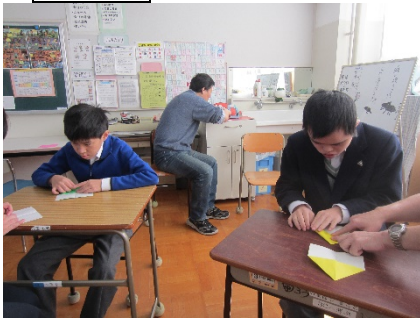
本番用の紙飛行機を作りました