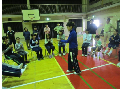
全校レク「震源地」、鬼です