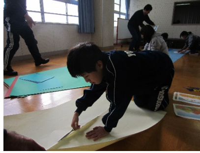
砂浜になる部分を切りました