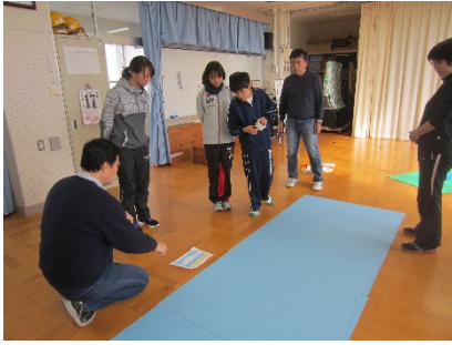
どのようにつくるか相談しています