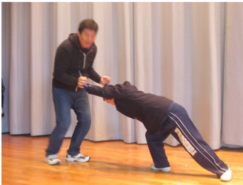
くま たお かくにん 熊を倒してセリフの確認