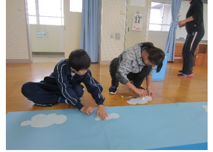
白い雲をつきました

16日(月)からの1週間は、体調を悪くして珍しく休みが多かったですね。24日(火)からステージでの練習が始まりました。1日(水)の予行練習、11日(土)のかしわ祭の本番に向けて、みんなと一緒に頑張っていきましょう。