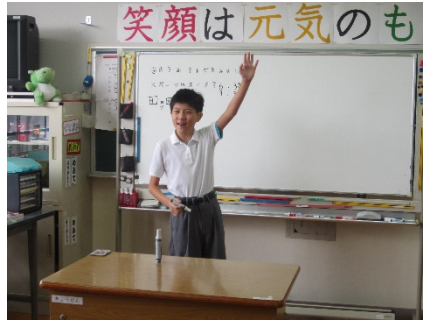
昨日、サッカーの試合を見た人