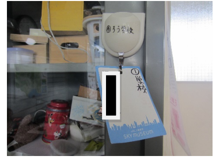
登校するとカードを裏返します

1日(金)から、午後の授業も始まりました。給食も始まりました。ずっと給食がないことを寂しがっていました。始まってとてもうれしそうでした。給食当番も楽しそうにしていました。