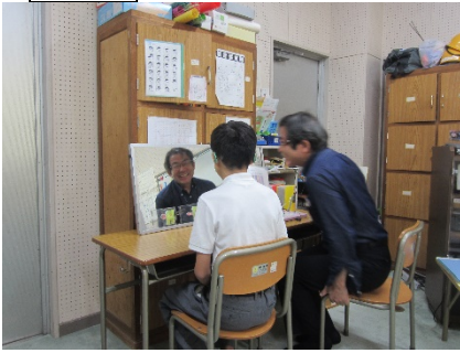
先生の口の形を見ています