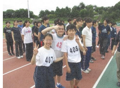
今年の開会式(後輩ができました)