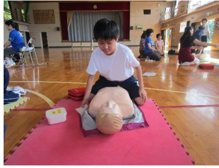
特に怖がることもなく、人形とご対面