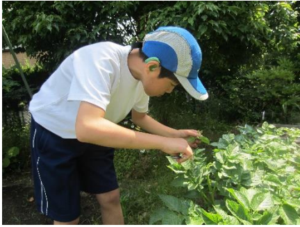
はさみで、つぼみを切りました