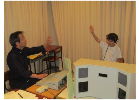
「聞こえていますか」、「ハイ」

30日(火)、2時間目の作業の時間に畑に行きました。前は芽かきをしましたが、今回は摘花を行いました。花が咲いてしまうと、地中のいも部分に栄養分がいなくなって、収穫時に大きないもができなくなってしまうので、花をつぼみのうちに切りました。