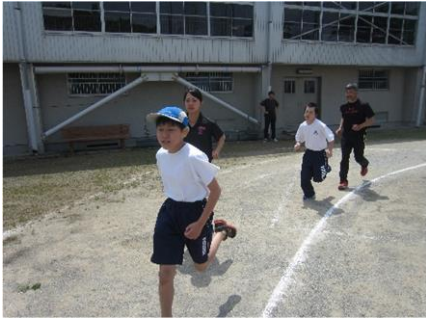
快調に走っています