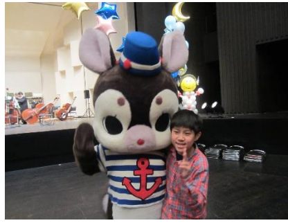
ゆるキャラに、大満足