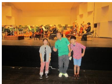
先生たちと開演前に記念写真。