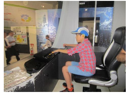
気に入って、長い時間運転しました

22日(月)スポーツテストの1つ、持久走1000mの授業でした。暑い中、長い距離を走るのので、準備運動をしっかりとやり、水分をしっかりと取って走りました。一度も止まらずに完走したのは2年生女子でした。自分の体調を考えて、途中で勇気ある棄権をしました。