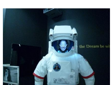
宇宙飛行士になりました