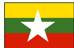
ミャンマーの国旗