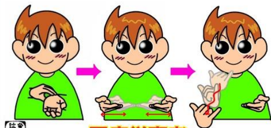
はしゅ 医療従事者

左手の5指で筒の形を作って、右手の2指で円を描いている動きを筒から覗き込みます。 顕微鏡でウイルスの動きを見る仕草からの表現です。