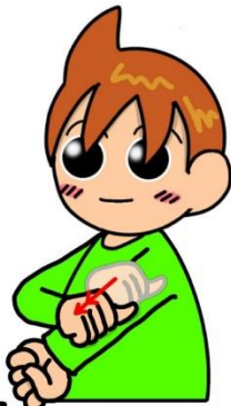
はしゅ アルコール(薬用)・消毒