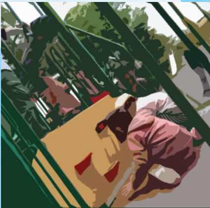
下から手が出てくる…