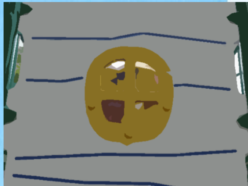
のぞいているのは誰？