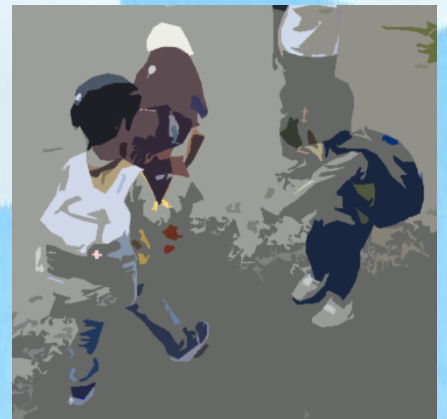
まねるだけで楽しくないます