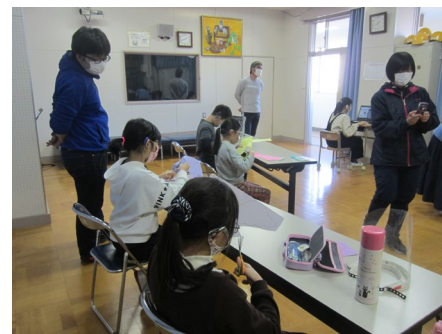
「パネルを作っています」

写真やスタンプなど自分で選んで作ったオリジナルの卒業アルバムが完成しました。自分でスタンプの位置や背景の色などを考えながら作りました。6年間の思い出がたくさんの世界でただ一つのアルバムができてよかったですね。