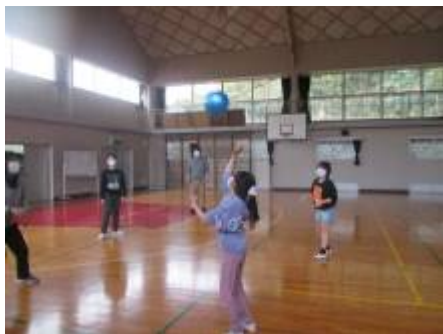
「みんなでバレーボール！」