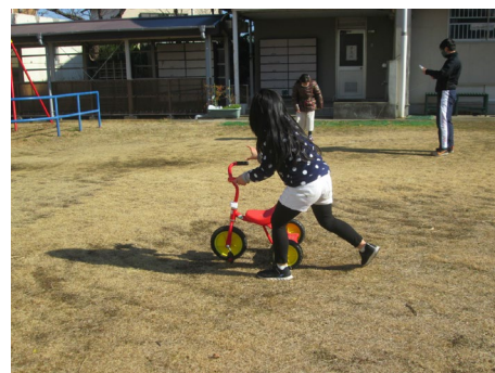
そと あそび、さんりんしゃ 三輪車