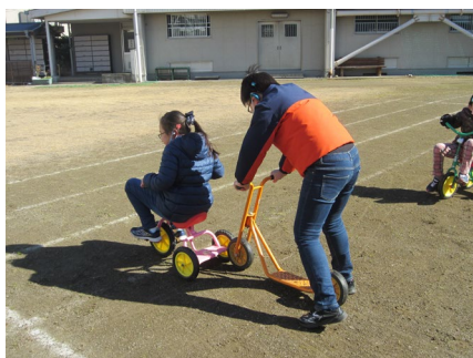
Mさんとトラック1周の競走です