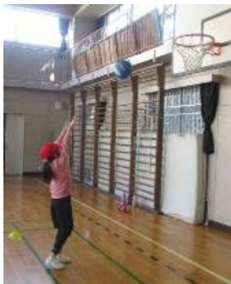
体育 バスケットのシュート