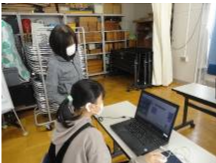
これで大丈夫かな

卒業に向けてアルバム作りが本格的に始まりました。17日（水）の1校時に作り方の説明がありました。写真を貼り付けながら構成していくのですが、Oさんは操作方法を直ぐに覚えて写真の大きさを考えて貼り付けていました。各学年ごとに行っているのでも少し時間がかかりますが、今月中に完成できるよう頑張っています。