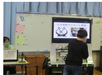
学活はスライドショーで総合の発表