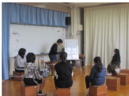
朝の会でトピックスを発表しました