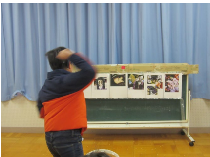
「鬼滅の刃」の的に向かって豆を投げました