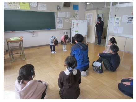
幼稚園がお礼の手紙を持ってきました