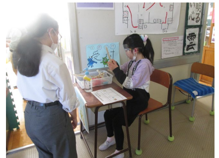
受付で、。お店の説明をしています