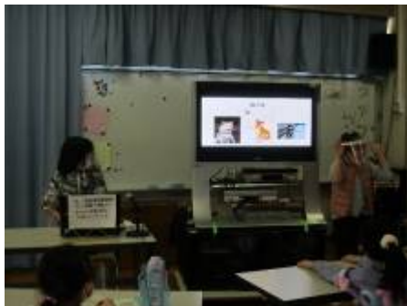
「わんにゃんクイズです。」