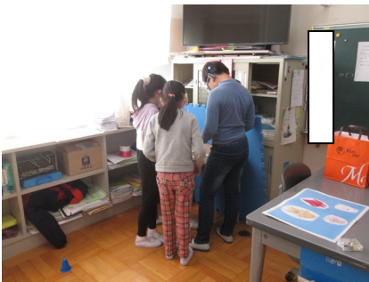
モンスターめいろの準備