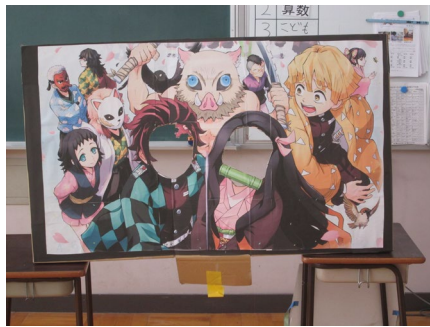
記念撮影のキャラクター