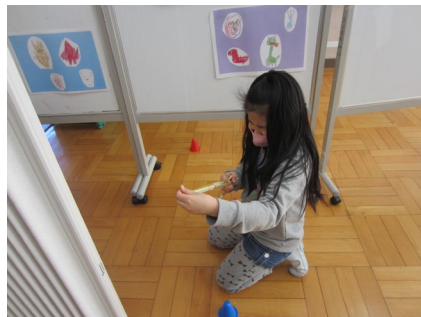
ゴム鉄砲の状態を確認しています