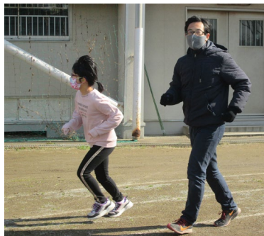
「走るの気持ちいいな〜」