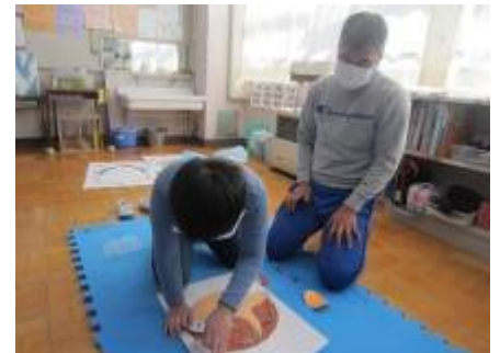
「福笑い」のお店で、「先生と

2日(火)は節分でした。毎年小学部の先生がおにの役をやっているの、子どもたちは、今年 はだれがやるのか楽しみに待っていました。みんなの予想を裏切って『鬼滅の刃』のキャラクター