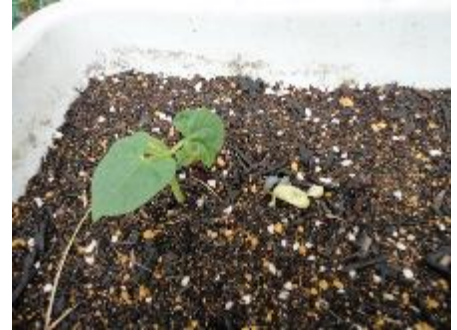
インゲン豆 (右側に芽の残骸が)