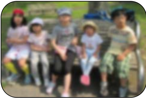
炎天下に歩いたので疲れた様子。