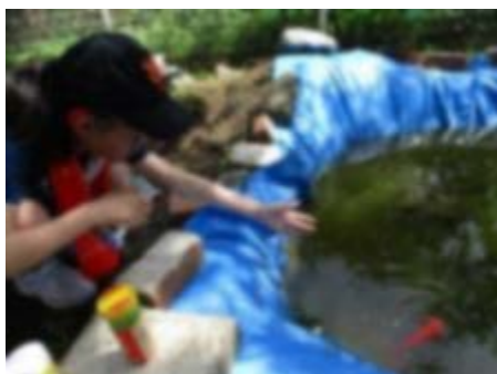
金魚にえさをあげてるよ！