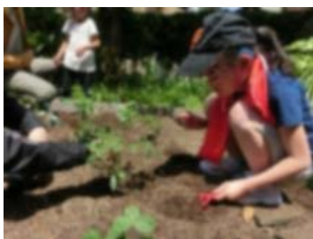
早くトマト食べたいね！