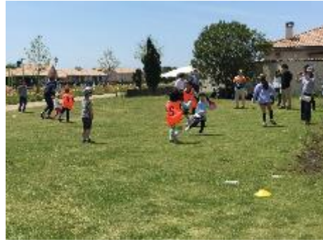
「こおり鬼をしています。」