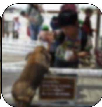
うさぎに にんじんをあげています。