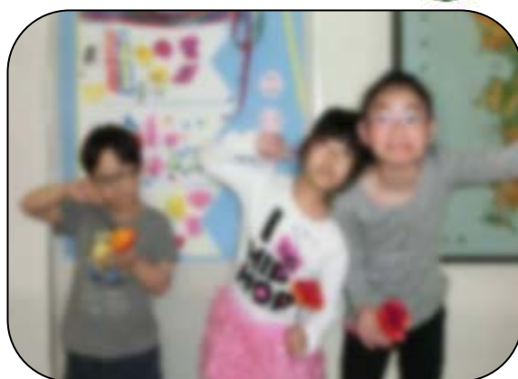
カーネーションの花を作りました。

合科でカーネーションの花を作りました。フェルト生地の花びらを線をみながらハサミで切ります。この作業を約5回繰り返し行い、一番したの花びらを茎の部分と接着します。そして作った花びらを一つひとつ茎にいれました。売りものになりそうなくらい素敵なカーネーションが完成しました。こういう作業を好きになったら、将来の仕事にもつなげられそうですね。