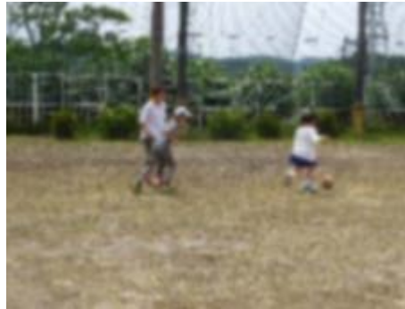
「みんなでサッカーをしています。」