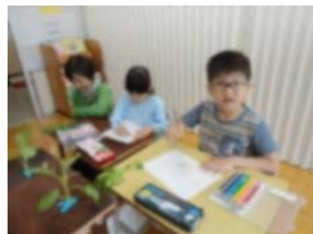
「どんなだったかな？」