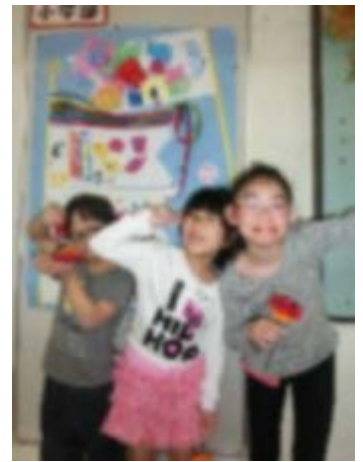
「カーネーションを作りました。」

最近のAさんのマイブームは日焼けです。「小麦色になる」と言って給食が終わるとすぐにグラウンドへ遊びに行きます。しかし、今週はあまり天気が良くなかったので、外へ出られず小麦色にはなれませんでした。