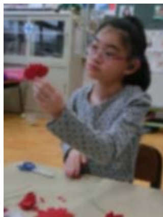
ワイヤーねじねじ