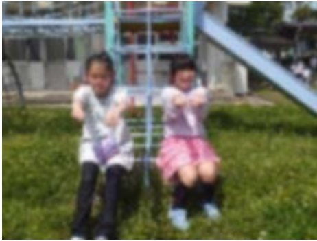
「日焼けをして小麦色を目指しています。」