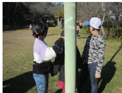
レク「だるまさんがころんだ」