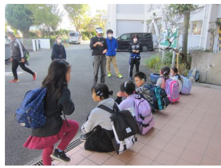
学校に到着、簡単にまとめの会