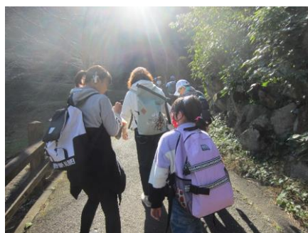
坂道も楽しい会話