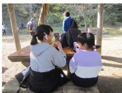
レクを行う広場で楽しく会話