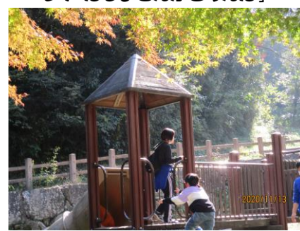
アスレチックを楽しみました