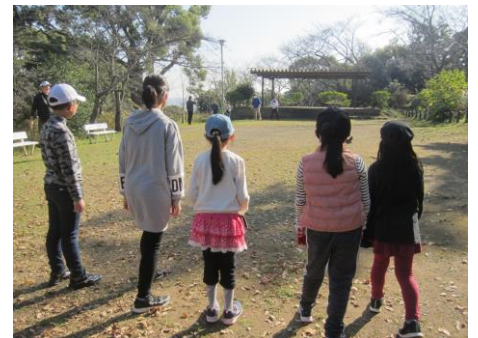
レク「だるまさんがころんだ」