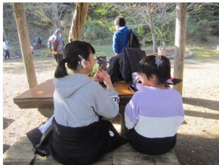
レクを行う広場に到着、Aさんと一緒に