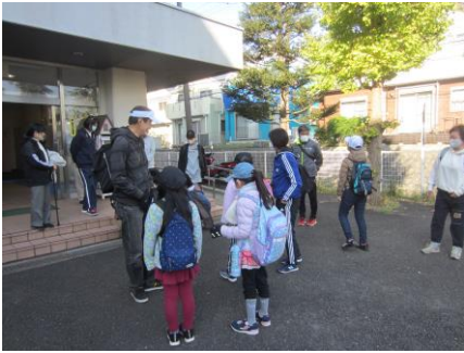
玄関前、みんなに見送られて出発