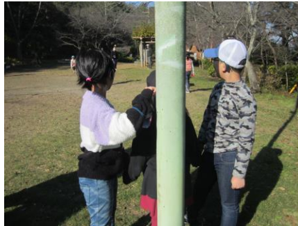
レク「だるまさんが転んだ」