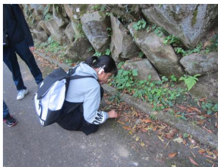
帰りにドングリを拾いました