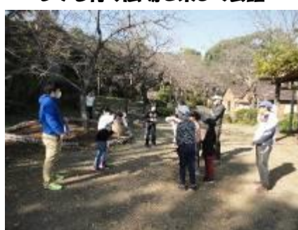
レク「写真当てゲーム」