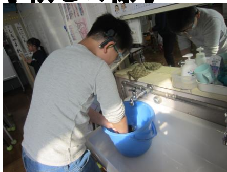
仕事係の黒板クリーナーの掃除