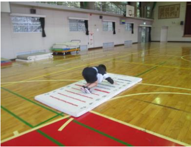
「マット運動をしています。」