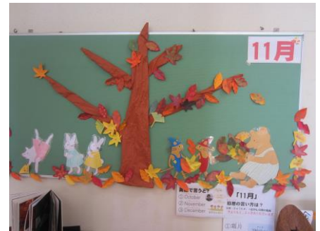
「今月の壁面はぐいとぐら。」

今週の2日(月)に秋の遠足に行く予定でしたが雨天のため延期となり残念でした。次は来週の金曜日に行く予定です。今のところ天気は心配なさそうですので、大丈夫だと思います。風邪をひかないようにしっかりと手洗いうがいをして、体調管理に努めてください。