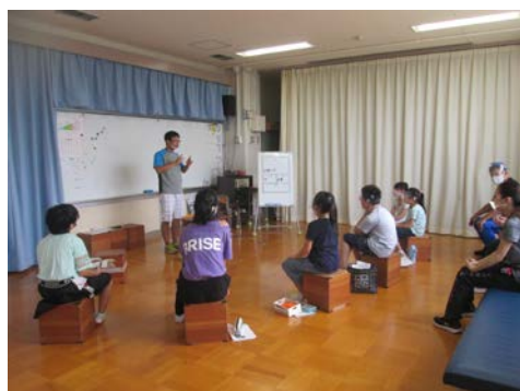
「学部全体で夏休みの過ごし方の発表会」

12日間の夏休みはどうでしたか？あっという間に終わってしまったのではないのでしょうか？