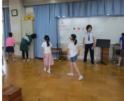
たからものさがし