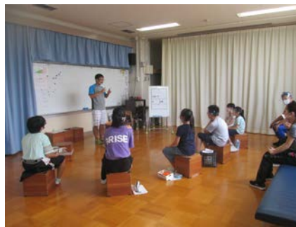
学部全体で夏休みの過ごし方の発表会