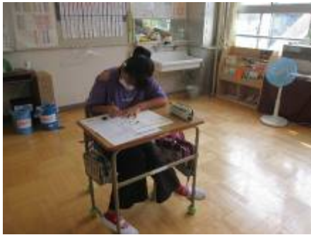
振り返りプリント記入

20日（木）に、漢字検定がありました。前日に練習問題を行ったのですが、当日は緊張していたようです。終わってから「ぎりぎりかも」と言っていました。発表が待ち遠しいですね。