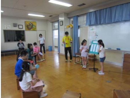
クラスの目標を発表しました