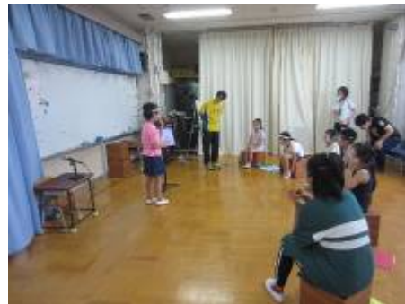
レク：カード探し 高い点数のカードはどこかな