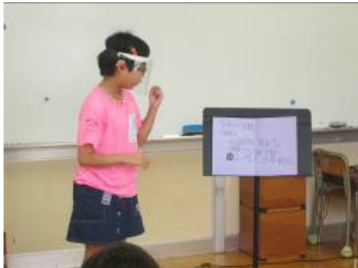
6年生の目標の発表