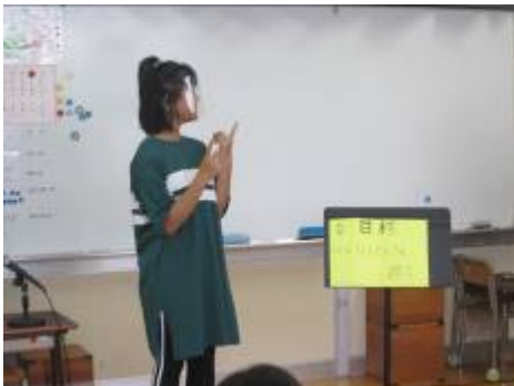
6年生の目標を発表しました

6日から17日まで、短い夏休みがあります。今年は大々的に遊びに行くということは難しいと思いますが、疲れた体を休ませることはできると思います。