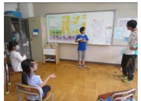
22日のレクの話し合いをしました