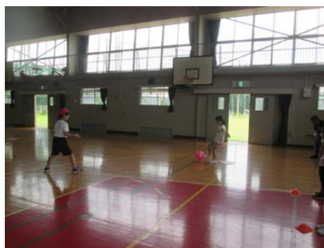
「体育の授業の様子、ボールゲーム」

今週の月曜日は雨が上がりいい天気だったので、臨時休校期間中にI先生が植えてくれた、ジャガイモを掘りました。今年は全部で26個取りました。中には緑色で食べられないものもあり、ちょうどいい大きさのものは16個取れました。家に持って帰って、食べてください。