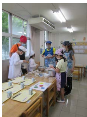
「給食の当番の様子」