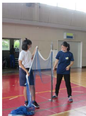
体育 バドミントンのかたづけ

早く梅雨明けすると良いのですが、まだまだジメジメとした蒸し暑い日が続きます。体調には十分気をつけて、暑さに負けず頑張りましょう。