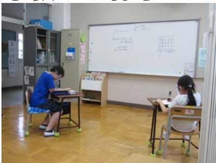
抽選会のくじを作っています