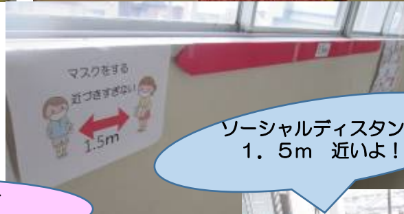
ソーシャルディスタンス 1.5m 近いよ！