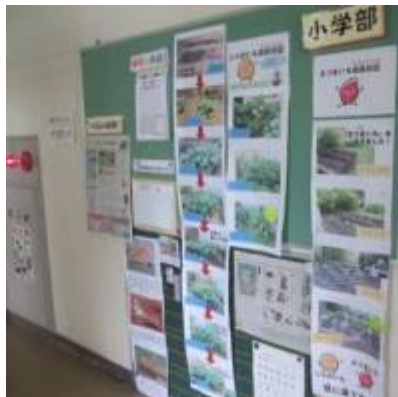
じゃがいも さつまいも成長日記