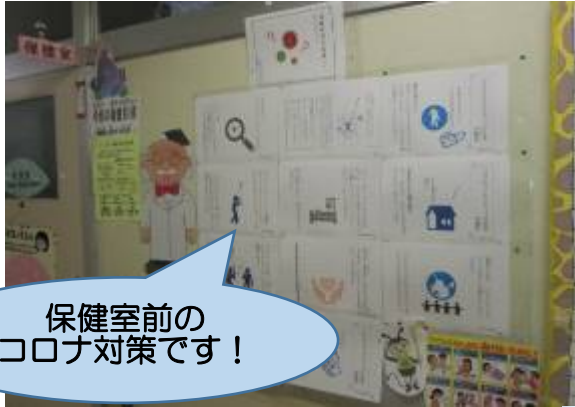
保健室前の コロナ対策です！