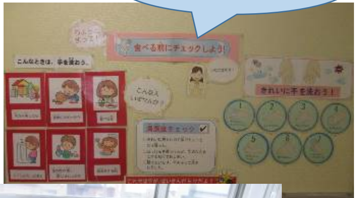
ランチルーム前の 「手洗いについて」