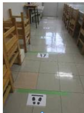
密にならない ように・・・