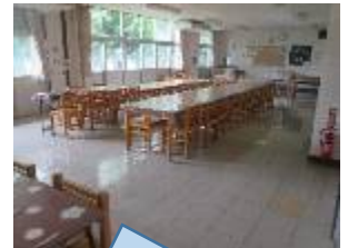
外側を向いて 食べます。