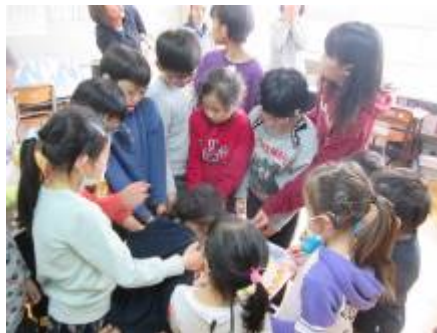
絵をもらいました