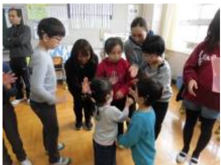
「お手紙ありがとう！」