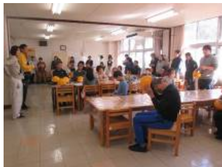
「予告なしの避難訓練がありました。」