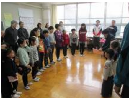
きちんと並んで聞いています