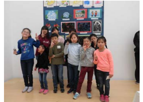
自分たちの作品の前で記念写真

21日(火)4回目の交流に行きました。予定では体育、理科、家庭科でしたが、グラウンド工事が入ったので残念でしたが、体育がなくなって学活に変更になりました。話し合い活動をしました。4月に決めた6年1組の目標の反省を話し合いました。目標は「な・・仲間と共に」「つ・・つらいときも」「し・・信じ合って」「ま・・前に進め」です。代表委員が中心になって三重円で活発に話し合いました。家庭科はミシンを使って、お世話になった在校生、職員に「感謝の気持ちをこめてぞうきんをつくろう!」でした。女子だけでなく男子も上手にミシンを使っていることにとても感心しました。