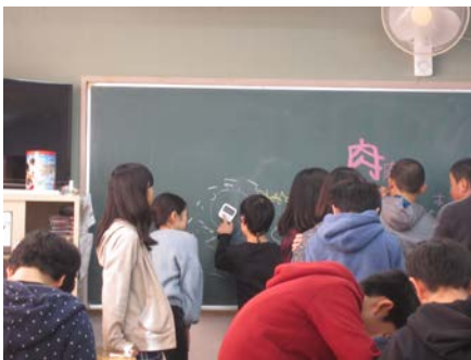
中休み、黒板の前に集まりました