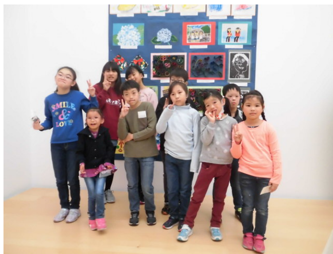
自分たちの作品の前で集合写真📷