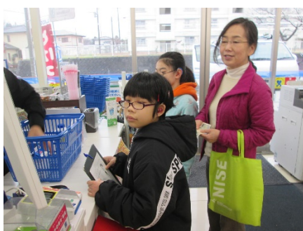
「牛乳とヨーグルトと炭酸水を買いました」