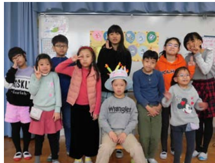
誕生会、記念写真を撮りました