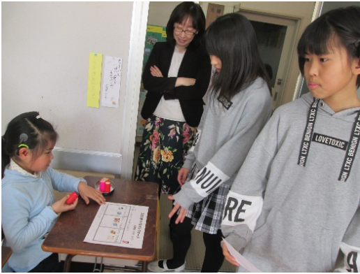
初めての受付がドキドキです。