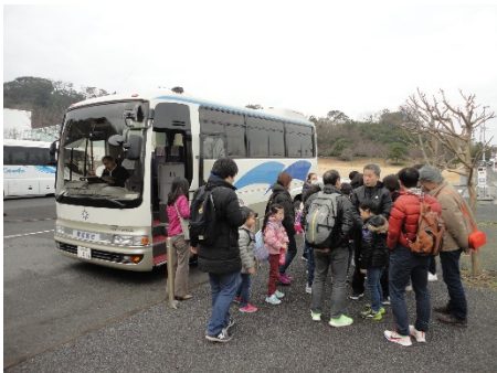
初めてのバスで美術館到着

美術館に着いた後は、担当者から説明や注意点を聞き、見学を開始しました。最初に児童・生徒の作品を見ました。自分の作品を見て嬉しそうでした。その後もゆっくりと作品を見て回りました。最後に見た作品は、陶器の作品かなと思ったら、木の彫刻と分かりビックリしました。本当に素晴らしいかったです。