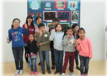
自分の作品あったよ!