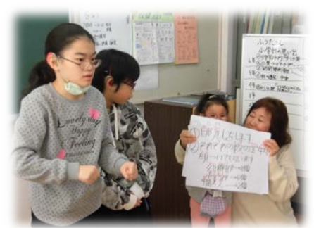
宝探しのルール説明♪