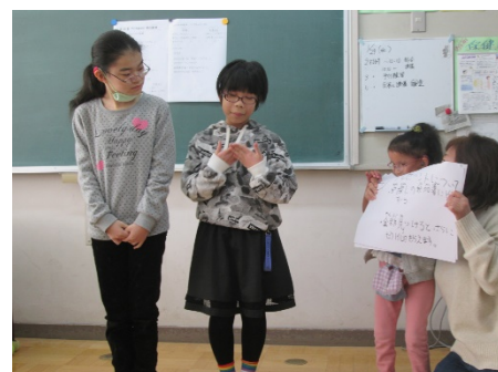
「プレゼントがもらえます。」

今週の水曜日にこどもまつりの予行練習がありました。みんなの前でしっかりとルール説明ができました。お店屋さんでもがんばることができました。来週はいよいよ本番です。お客さんがたくさん来てくれるようにしっかり準備をしましょう。