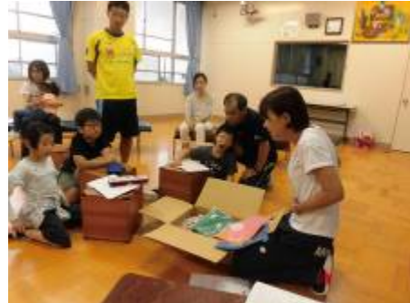
衣装の話を聞いています