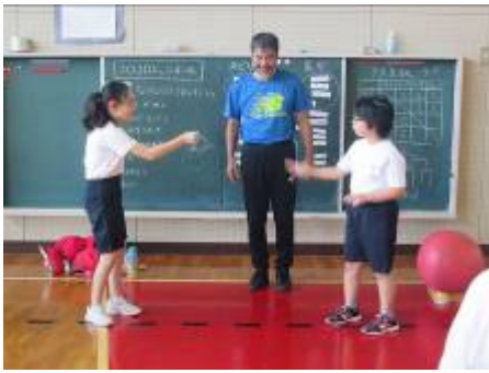
「どっちが攻撃するか、ジャンケン」