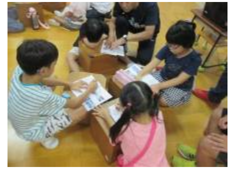
「遠足の話し合いをしています。」

火曜日に交流に行きました。交流先では英語やお月見団子などを作りました。音楽では初めてリコーダーを吹き、先生のリズムに合わせて吹くことができました。どの授業も楽しそうに受けていたので良かったです。