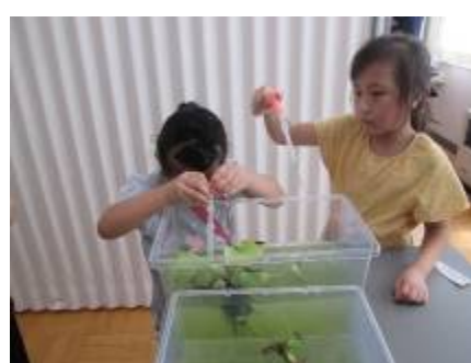
うんちをとってあげよう！