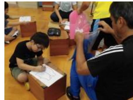
どのような服にするかな..