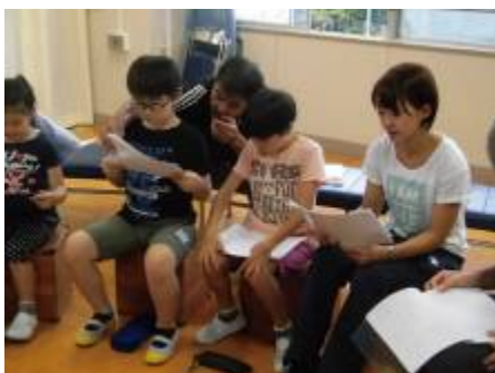
初めての読み合わせ