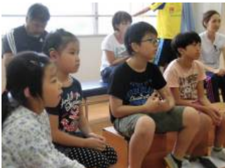
真剣に話を聞いています

18日（水）の5校時に、劇の台本読み合わせを行いました。初めてだったので、うまく言うことができるか心配でしたが、大きな声で上手に言うことができました。読み合わせが終わった後、お父さん役の衣装を着てみました。大きさは丁度良かったので、必要なボタンやポケットなどを作って取り付けたいと思います。