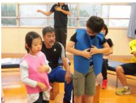
今回も青い衣装です 似合っているかな