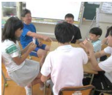
中高等部で楽しくUNO