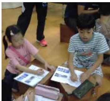
班長として、しっかり下級生をサポート