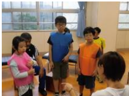
かしわ祭の衣装の相談しました