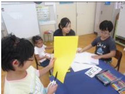
お月見の準備をしました