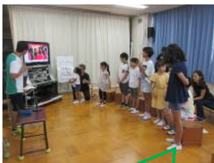
テレビを見ながらダンスの練習◆

かしわ祭の劇の練習が少しずつ始まりました。Aさんは台本を持ち帰って家で練習をしておりともやる気になっています。学校ではダンスの練習をしたり、衣装を作ったりしています。劇は5年生と6年生が中心になりますので、小学部の劇のリーダーとしてみんなを引っばって欲しいと思います。