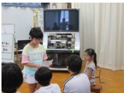
「すみっこぐらしのゲームを買ったよ」