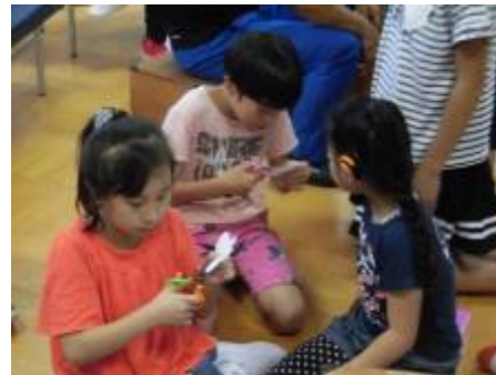
衣装作り!先輩がお手伝い!