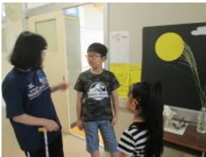
十五夜の前で何を話しているのかな