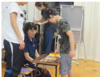
かしわ祭の衣装決め