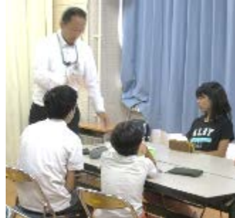
「チェック、キビシイな」