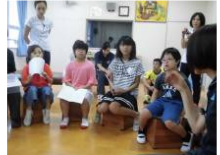
「台本の読み合わせをしたよ。」

今週の木曜日にお月見団子を作りました。火曜日の事前学習では月の形の勉強をしました。また、味については「あんこは苦手」と言っていましたが、去年はみたらしを食べたので、今年は新しい味の勉強ということであんこの団子を美味しく食べることができました。