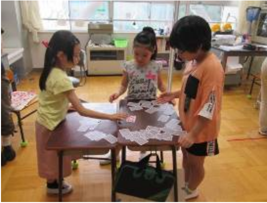
最近よく遊ぶトランプゲーム 名付けて「7・5・3」です。