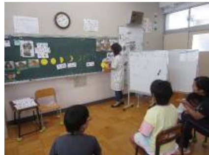
「お月見の勉強をしたよ」