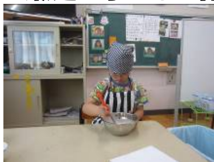
フルーチェを作っています