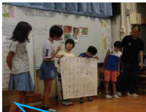
5・6年生で話し合ったことを発表!