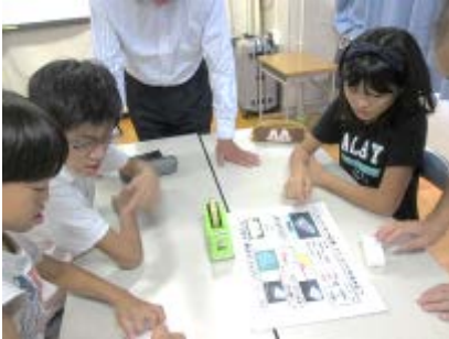
作業工程の確認と役割の相談