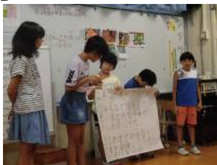
かしわ祭の目標の構造紙を持ちました