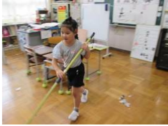
13日昼清掃でがんばりました。 きれいになるときもちいい!