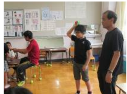
昼休みの様子:ボール投げ