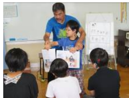
トピックスで発表した紙を持っています

10日(火)は、午前中N小学校に交流に行きました。午後の合科は先週に続いてフルーチェづくりをしました。家庭科室に行って道具を準備しましたが、写真を見せるとどこにあるのかすぐ分かって用意できました。作り方も分かっていたので、手際よく作りました。ちょうど廊下を通ったNさんにも声をかけて一緒に食べました。自分だけで食べるよりも美味しかったようです。