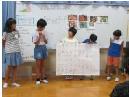
「かしわ祭の目標は・・・」