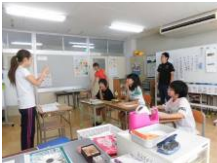
「かしわ祭の話し合いをしています。」