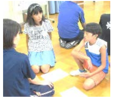
どうイメージにしようか

11日（水）5校時の学活で、かしわ祭の取り組み目標と劇の配役が決定しました。その日のために、5、6年生は話し合いを重ねてきました。目標や配役の原案を練り、自分たちで提案することができました。5、6年生は台本に「 いち 〜 に 二度は目を通してきた子がほとんどで、「さすが上級生。たのもしいな。」とうれしくなりました。