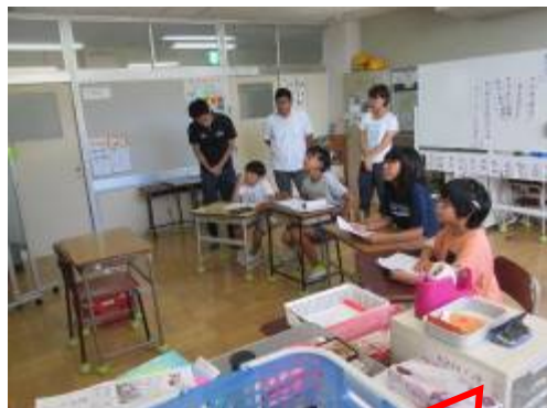
5・6年生で話し合って決めます♣

先週は、京急線の踏切事故もあり、社会が混乱するような事件がいくつか起きています。そんな中でも落ち着いて行動ができるように、日頃から「こんな時はどうする？」と家族で話し合っておくと良いでしょう。