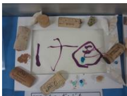
夏休み作品展に出した作品