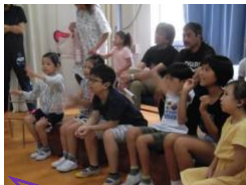
みんなでダンスの練習をしたよ♠