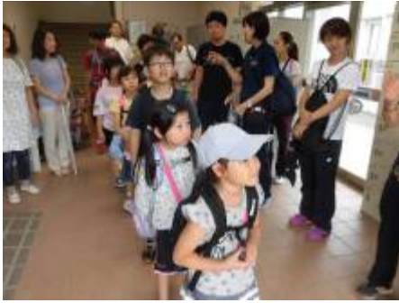
最前列で「行ってきまーす！」

9月4日(水)不入斗アリーナのプールで3回目の水泳授業がありました。Rさんは、友だちと楽しく泳ぎ、泳ぎ方をいろいろ教えていただいて、深いプールでもたくさん泳げたと嬉しそうに話してくれました。何事も体験が大切ですね。来年はもっと泳げるといいですね！