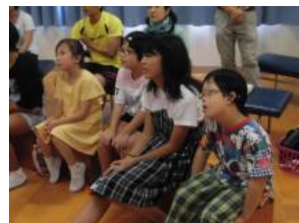
前回のビデオを見ました