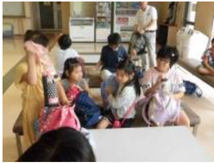
プール施設に到着しました。