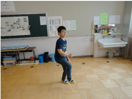
DA PUNP「カーモンベビー アメリカ」