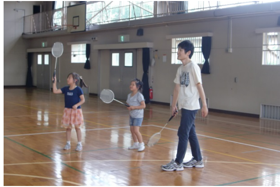
退任する先生と一緒にバドミントンを楽しみました