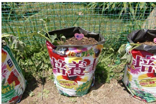
今年は培養土の袋にサツマイモを植えました