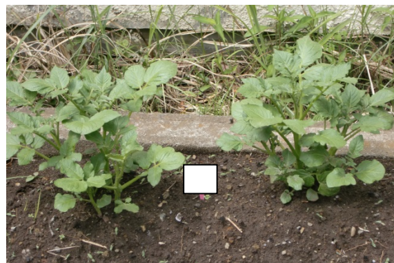
ジャガイモが大きく生長しています