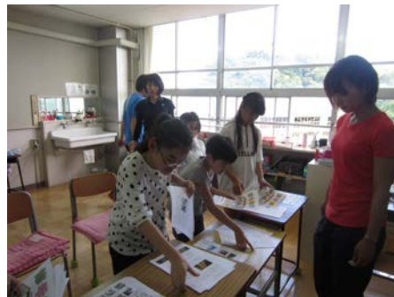
みんなで協力してしおりづくり