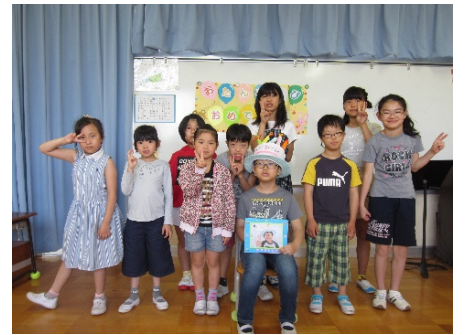
みんなで記念写真