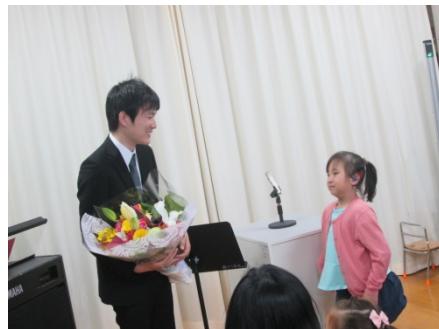
退任の先生に花束を渡しました