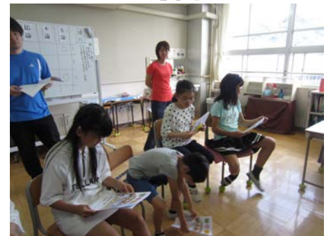
できたしおりを見ている