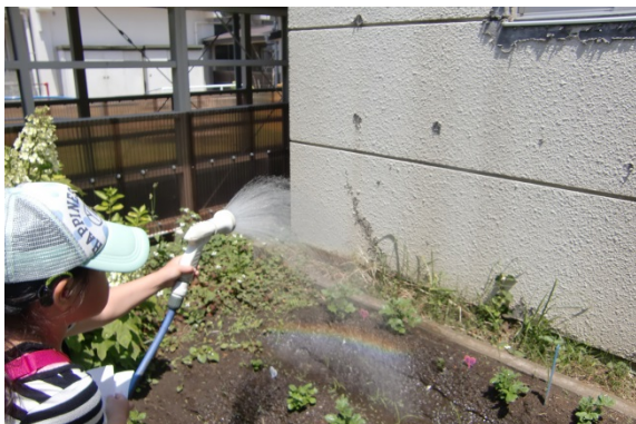
水をかけたら、虹が出ました