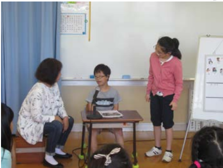
トピックスにKさんが質問しました