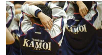
「真剣さ」が伝わる表情・姿勢！！