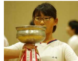
「3連覇」の優勝カップの重さ！