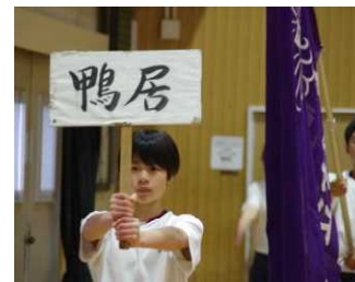
「横須賀市立鴨居中学校！」