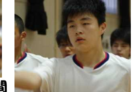
精一杯を表現しあえる仲間