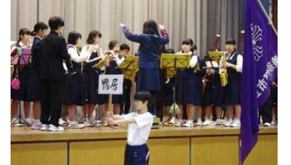
吹奏楽部の生演奏での行進練習！