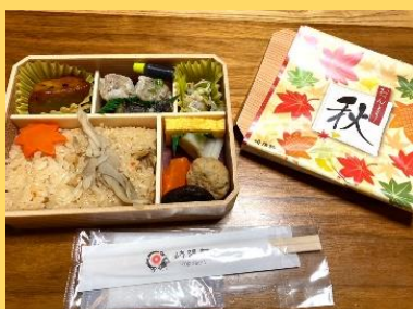
崎陽軒 秋のお弁当

～参加された方の声～ (実施後アンケート一部抜粋) 「普段自分だけだったら絶対行かないような場所、体験ができてとても有意義でした」「解説もおもしろく、一日楽しめました」