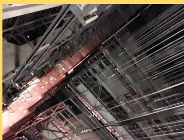
照明・幕を吊るワイヤー