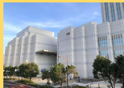
横須賀芸術劇場外観