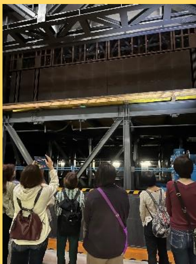
迫り上がりステージ

11月10日秋晴れの中、PTA 社会見学が行われました。当日は28名の方に参加していただきました。 劇場のバックステージを1時間かけて階段を昇り降りしながら巡りました。 搬入口→奈落→舞台裏→照明関係室→舞台→楽屋の順で見学しました。 その後は軍港めぐり。観艦式後だったので、めずらしい海外の軍艦を見ることができました。