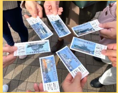
チケットの絵柄は全部で10種類