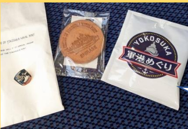
下船後お楽しみ抽選会。 ご参加された方が当選。