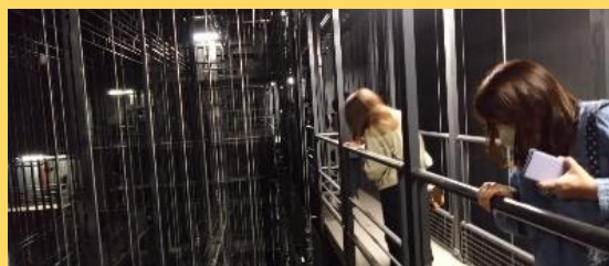
キャットウォークから25m下を覗き込む