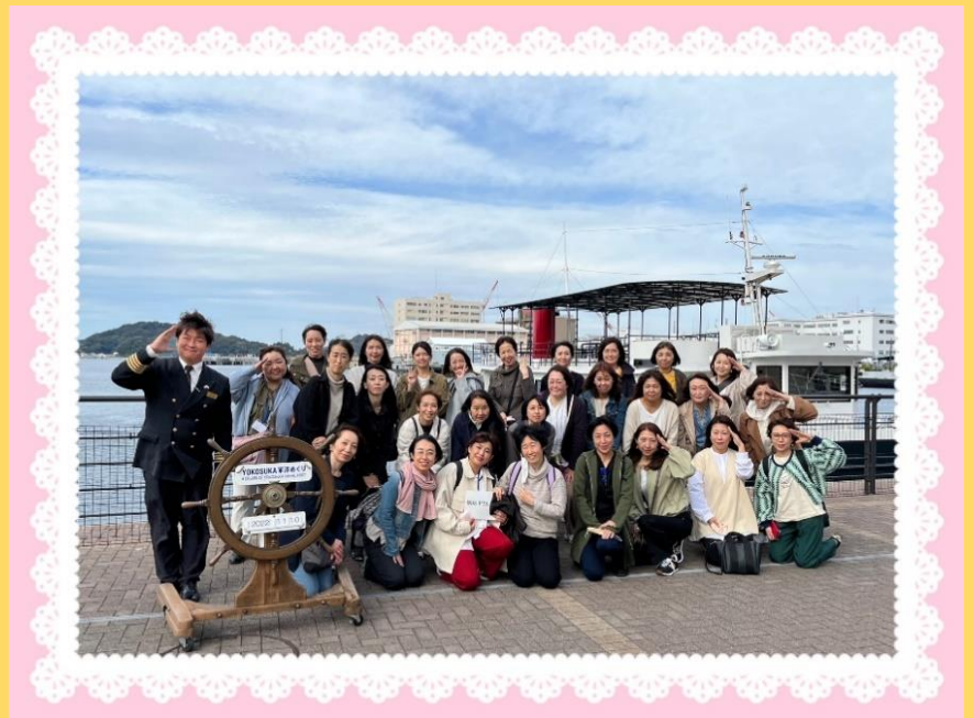
案内人さんと一緒に記念撮影