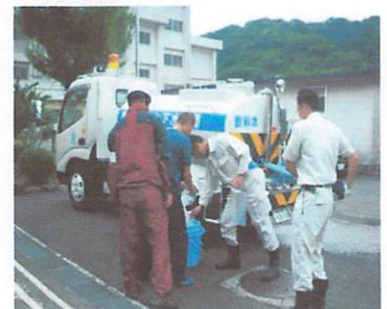
給水車から給水作業中