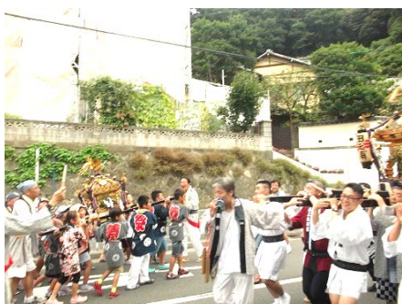
東長浦の子ども神輿

日焼けでちょっと黒くなったニコニコ顔の子ども達が久しぶりに学校に戻ってきて、木曜日から前期の後半がはじまりました。33日間の夏休みが終わり、みんなが元気に登校したことを大変うれしく思います。梅雨明けの宣言がされてから天候不順な日が続き、猛暑の予想はどこへ行ってしまったのか?という今年の夏でした。さて、夏休み前の朝会で、「地域の行事にすすんで参加しましょう。」と声をかけました。休み中に東長浦と長浦の祭礼、安針台の納涼祭を見させていただきました。夜店で買い物をするなど、子ども達が楽しそうに行事に参加している姿をたくさん見ることができました。さらに子ども神輿を担いだり、お囃子を奏でたり、また演芸会に参加して校歌を歌ったりジンギスカン体操を踊ったりと、地域で活躍している姿を見てたいへんうれしく思いました。保護者の皆様・地域の皆様ありがとうございました。