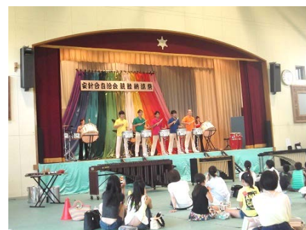
安針台 たいこのパフォーマンス