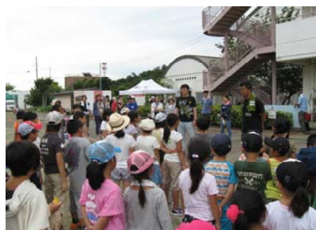
—楽しいディ・キャンプ—