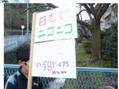
4年生が手作りの旗で見送ってくれました。

たくさんの方々の応援のおかげで実施できたことに感謝し、同時に、6年生一人一人が力を発揮して、成果を感じる旅となりました。