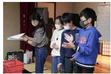
レクもみんなで楽しく盛り上がりました。