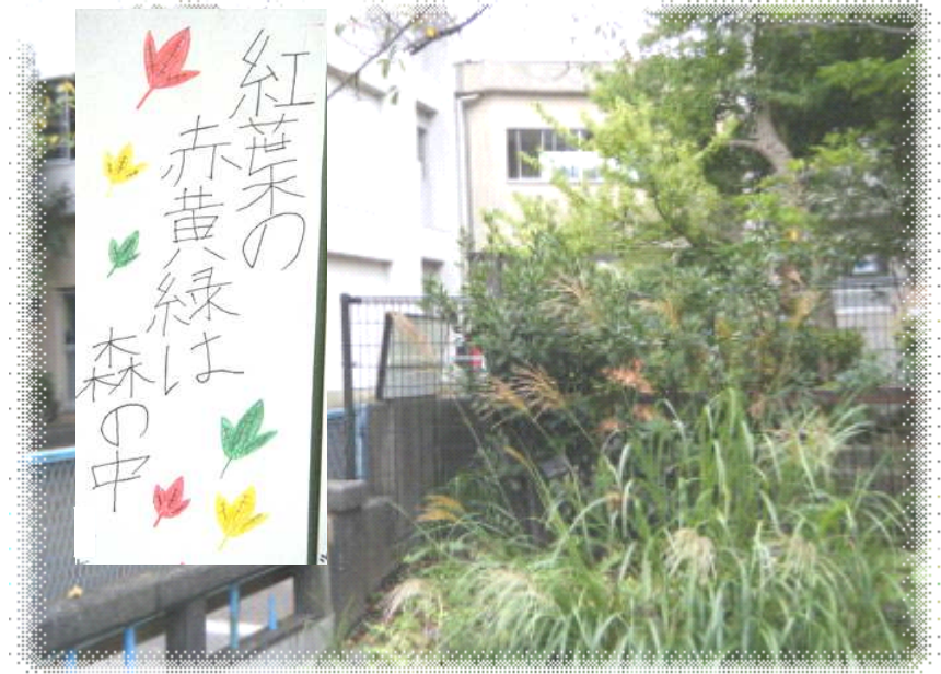
なかよし橋とススキ