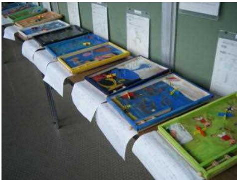
4年生:くぎ打ち名人

9月1日（火）・2日（水）の授業参観、また、4日（金）の学級懇談会には、ご多用の中、ご来校いただき、ありがとうございました。感染症対策をしながら、今年度初めての授業参観でしたが、何より 子どもたちの笑顔と張り切りよう が印象に残りました。6年生の教室からは、男の子が二人廊下まで出てきて「 どうぞ、お入りください 」と声をかけたり、1年生や2年生の教室では、 いつも以上に元気な挨拶 で授業が始まったりしました。3、4年生の教室前には、 図工や書写で仕上げた作品 が並び、5年生の教室前には チームの旗6枚が堂々と 掲げられていました。学校で頑張っている姿を見ていただくことが、子どもたちの大きな励みになる、ということに改めて感じる機会になりました。