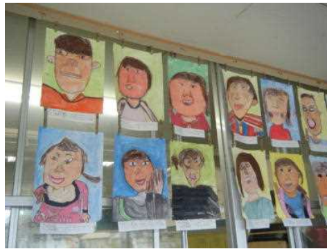
3年生:すてきな自分